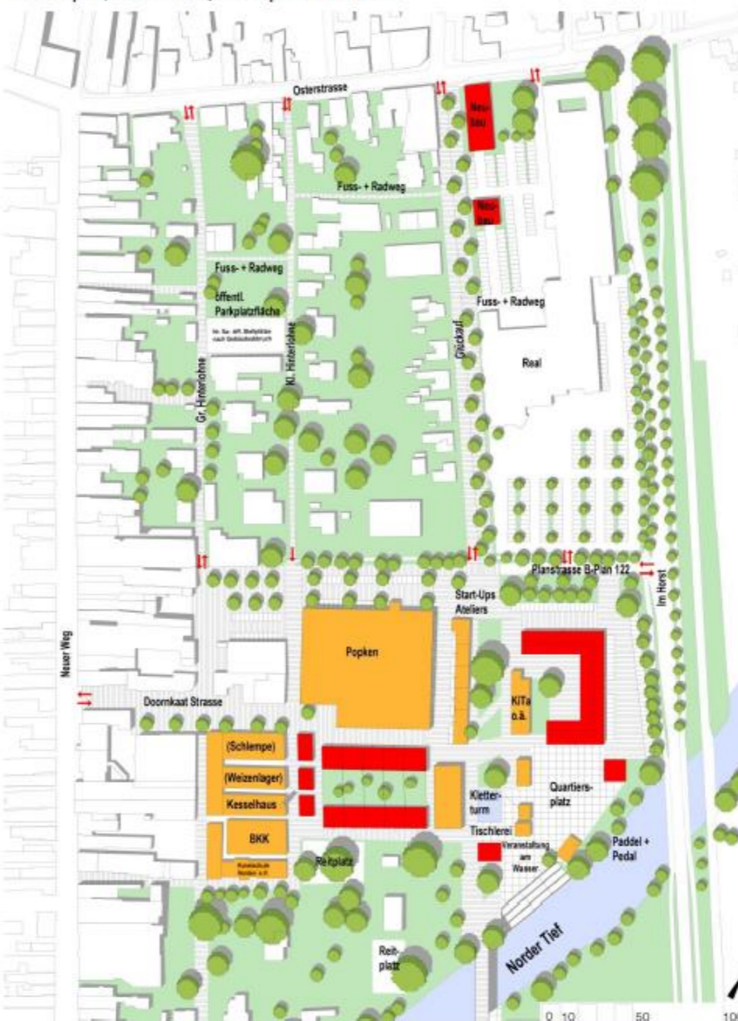
Rahmenplan, Variante B: Quartiersplatz am Wasser

Droste, Droste & Urban + Stadtlandschaft