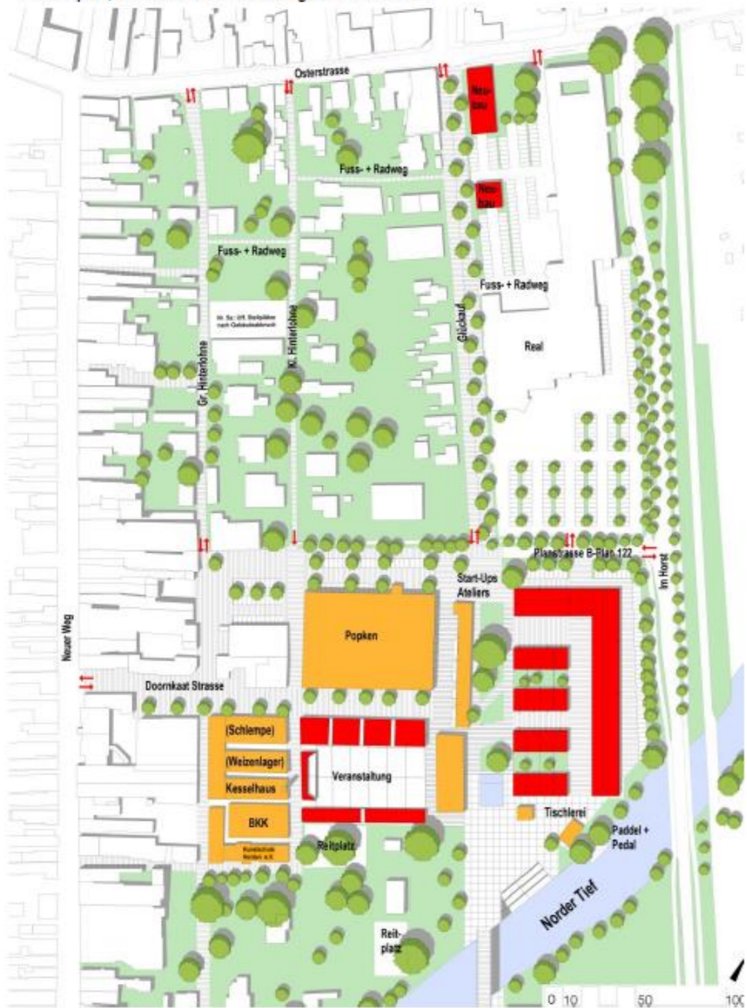
Rahmenplan, Variante A: Veranstaltungen am Kesselhaus

Droste, Droste & Urban + Stadtlandschaft