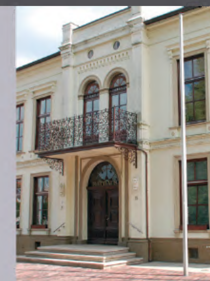
1 Rathaus Am Markt 15

(Rechts: Markante Gebäude rund um den Marktplatz)