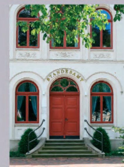
2 Bürgerdienste und Sicherheit (Standesamt) Am Markt 19