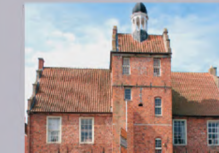
16 Altes Rathaus mit Ostfriesischem Teemuseum