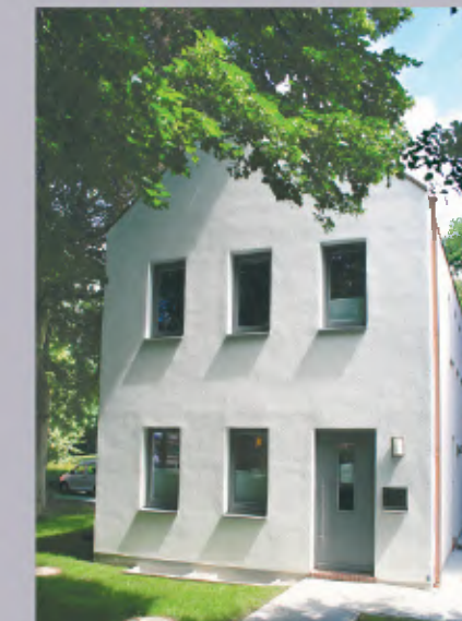
4 Stadtentwässerung Norden Am Markt 41