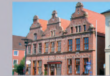
10 Drei Schwestern