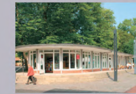
8 Marktpavillon mit Marktcafe und Öffentlichen Toiletten