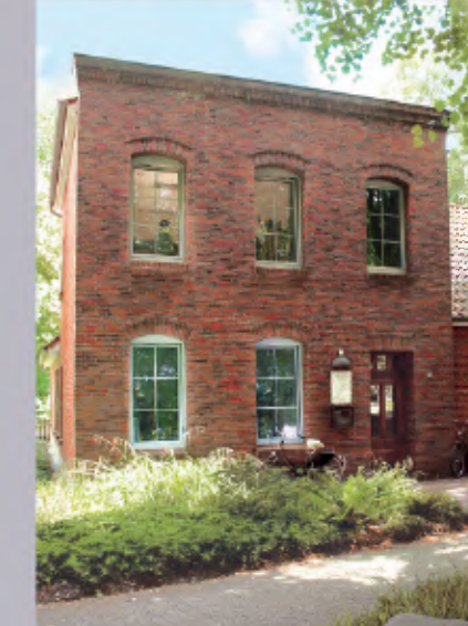
5 Stadtplanung und Bauaufsicht Am Markt 43