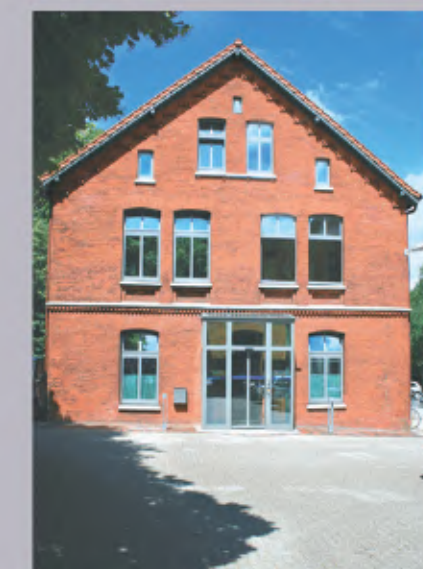
3 Fachbereich Planen, Bauen, Umwelt Umwelt und Verkehr Wirtschaftsförderung und Stadtmarketing Am Markt 39