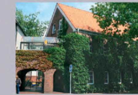
12 Volkshochschule Norden