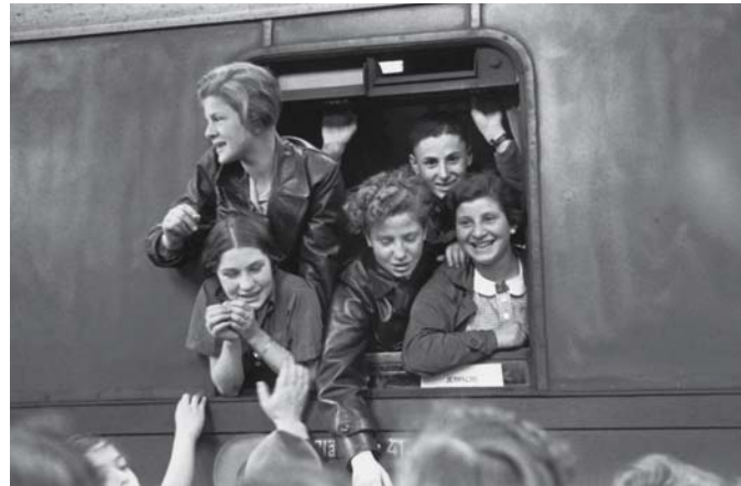
Jugendliche verabschieden sich am Anhalter Bahnhof in Berlin von ihren Familien, 1936, Jüdisches Museum Berlin